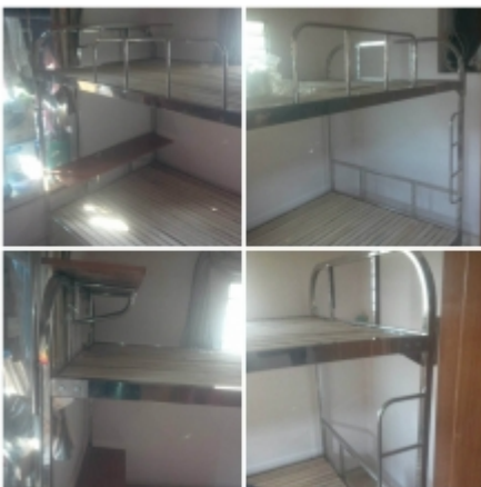
GD: GIẾ'á»œNG Tá'ING INOX MINH NGOC 02 Gá»i Ä'á»f biáº;t giÄi