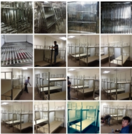
GD: GIẾ'á»œNG Tá'ING INOX MINH NGOC 01 Gá»i Ä'á»f biáº;t giÄi