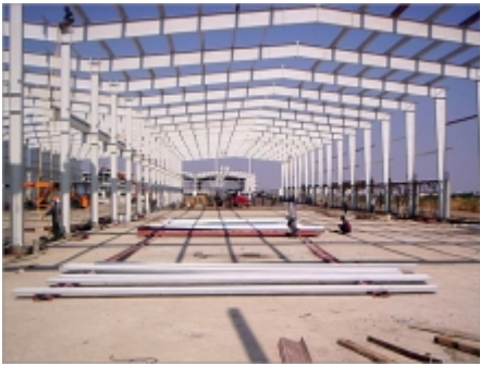
KHUNG NHÀ THÁP Gá»i Á»f biá»t giÃi