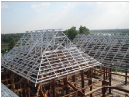
KHUNG NHÀ THÁP Gá»i Á»f biá»t giÃi